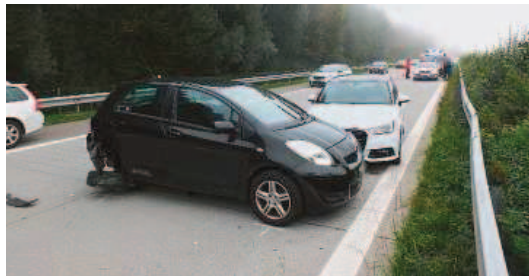
Ein Unfall auf der A13 sorgte gestern Morgen in der Hauptverkehrszeit für Stau.