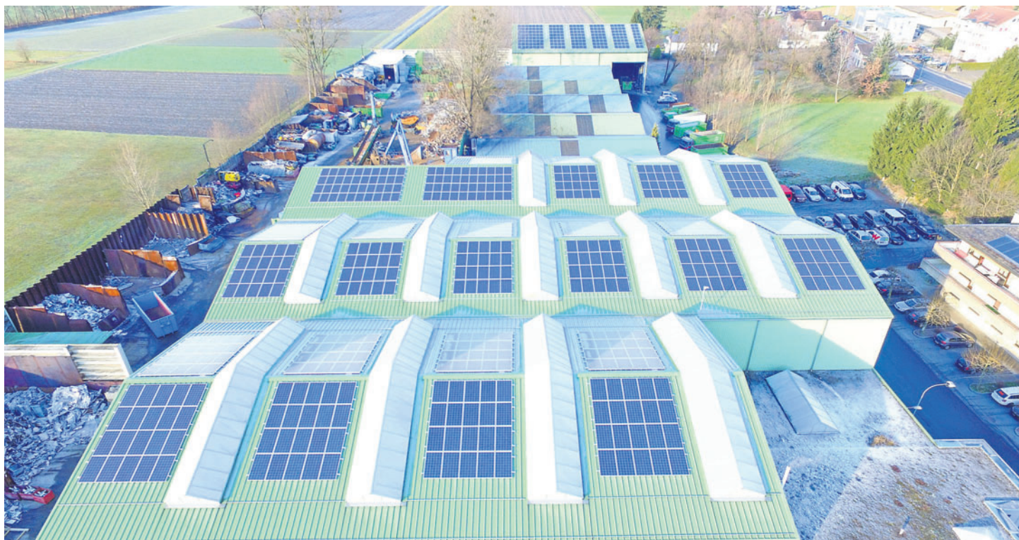
Die Solaranlage auf dem Dach des Recyclingcenters Elkuch Josef AG in Eschen ist die grösste an einem Messpunkt angeschlossene Fotovoltaik-Anlage in Liechtenstein. Jährlich werden circa 240 000 kWh an erneuerbarer Energie für den Eigengebrauch der Firma produziert. Umgerechnet könnten damit circa 50 Einfamilienhäuser versorgt werden.